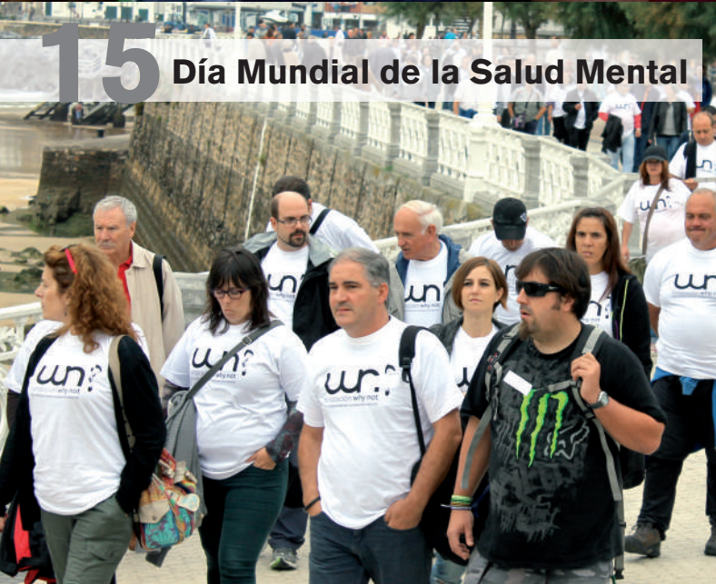
Día Mundial de la Salud Mental