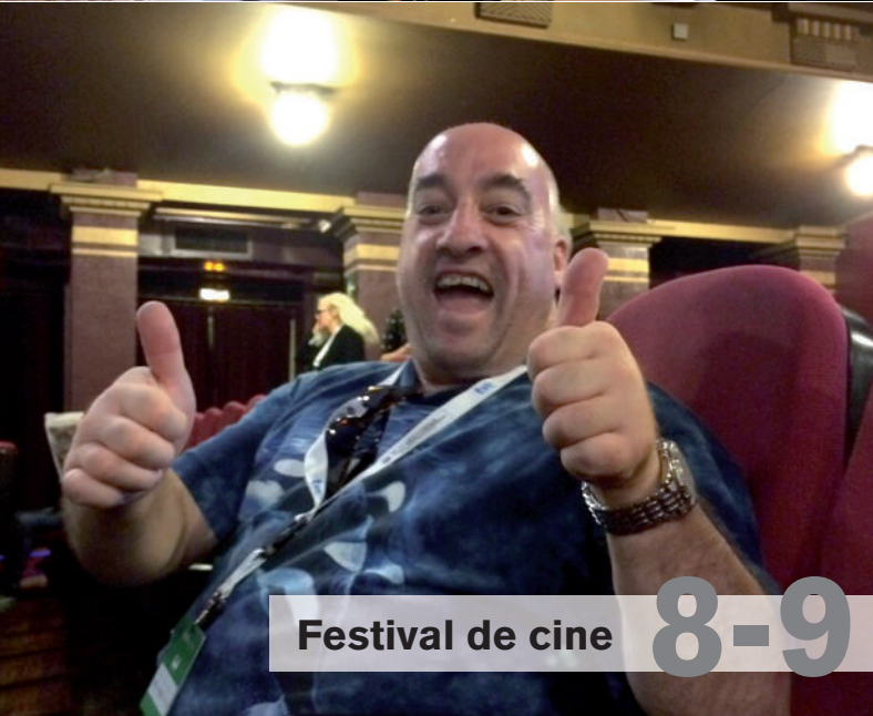
Festival de cine