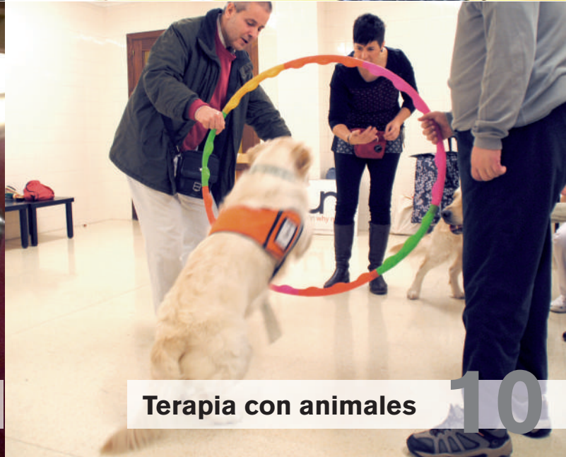
Terapia con animales