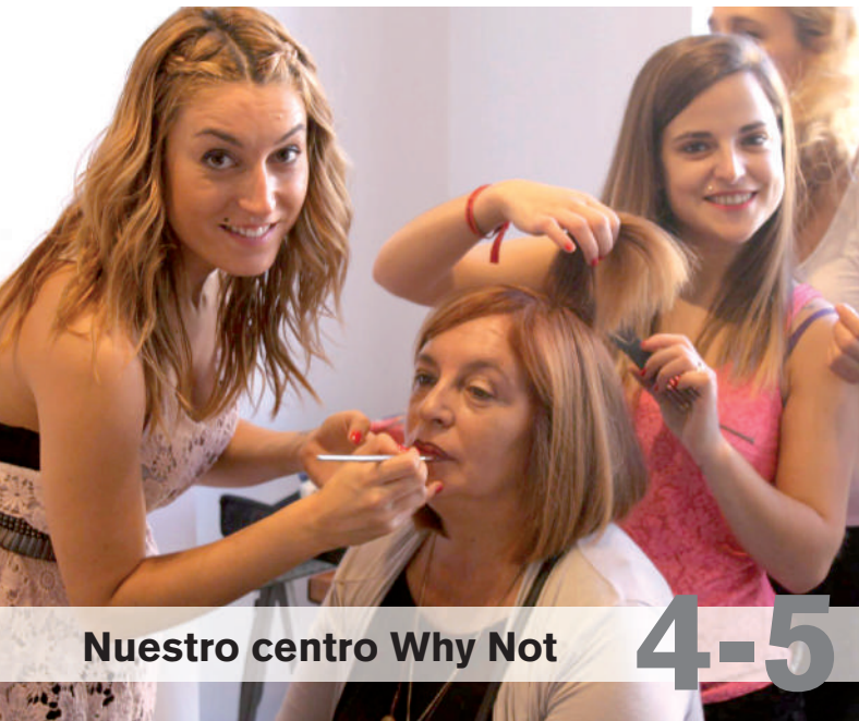
Nuestro centro Why Not

15-21 Actividades 24-25 Eventos solidarios 27 Historias de la radio