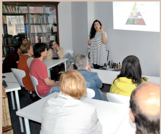
Cata de perfumes