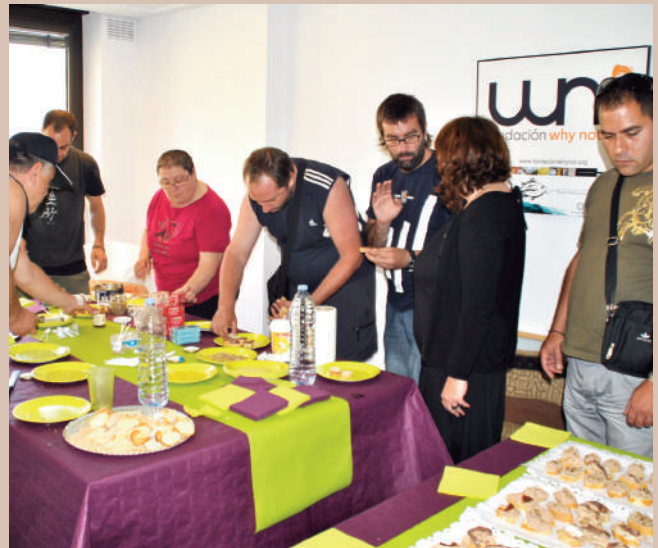
Taller de pinchos