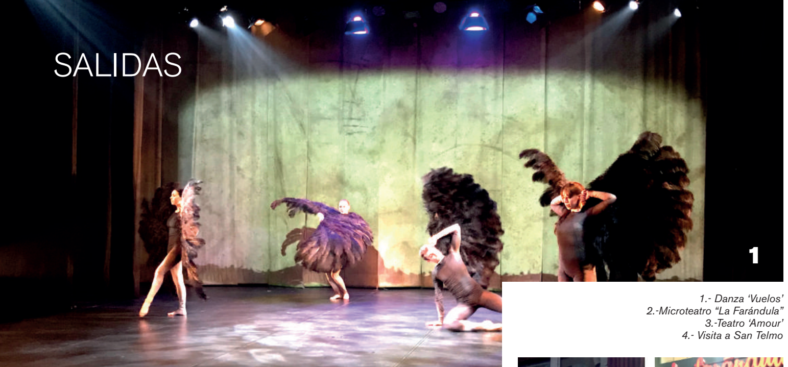
1.- Danza 'Vuelos' 2.-Microteatro "La Farándula" 3.-Teatro 'Amour' 4.- Visita a San Telmo