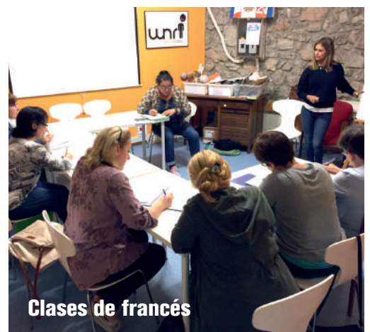
Clases de francés