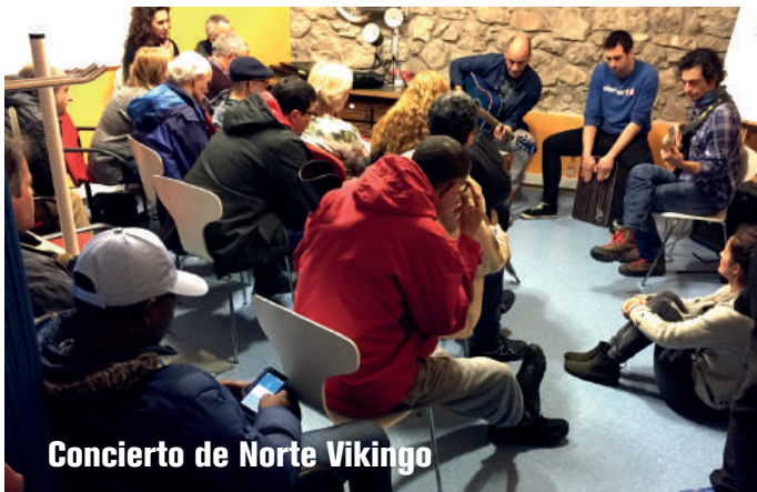
Concierto de Norte Vikingo