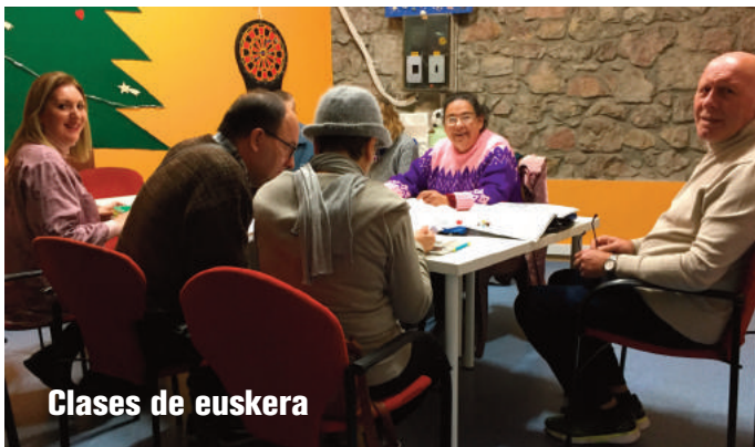
Clases de euskera