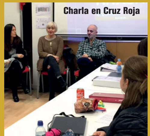
Charla en Cruz Roja

Fue una visita distinta de las que solemos hacer, en un ambiente agradable con las alumnas del Certificado de Profesionalidad de Atención Sociosanitaria en Instituciones Sociales. En su mayoría eran mujeres. Explicamos lo que es la enfermedad mental desde nuestra experiencia, fuimos muy bien acogidos, incluso nos contaron que alguno había pasado por nuestra situación. Se interesaron mucho por la forma distinta de Fundación Why Not, que se centra más en impulsar nuestra integración con ayuda del tiempo libre y ocio. Les gustó mucho que en la fundación somos personas capaces de hacer lo que nos proponemos, nos cambia la vida, hacemos multitud de talleres y diversas actividades. Gracias a la Cruz Roja por acogernos con tanto cariño, respeto y con ganas de saber de estas enfermedades desde nuestra vivencia.