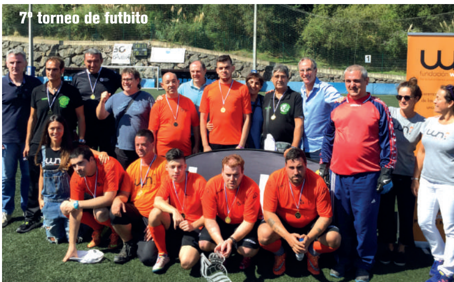
7º torneo de fútbolito