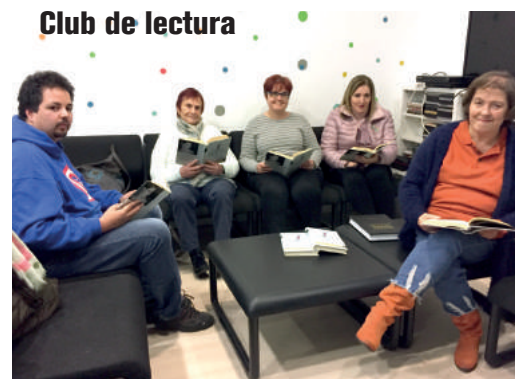
Club de lectura