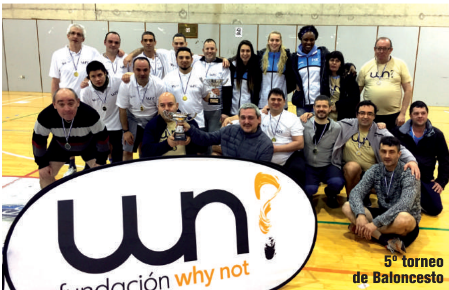
5º torneo de Baloncesto